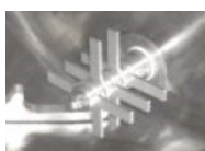
Messerkopf zur verfahrenstechnischen Optimierung