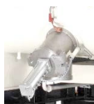
Auslaufvarianten – für jede Situation