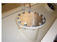
Zusätzliche Einlaufstutzen, variabel in Größe und Position