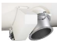
Ausrüstung mit zusätzlichen Ausläufen