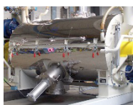
Isolierung aller gekühlten Behälteroberflächen