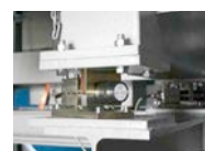
Mischer auf Wägezellen, z.B. zur Entleersteuerung