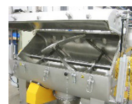
Doppelmantel aus Edelstahl – auch mit Revisionsklappe