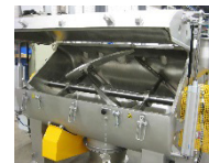
Doppelmantel aus Edelstahl