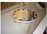
Zusätzliche Einlauf- stutzen, variabel in Größe und Position