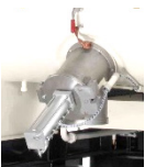
Auslaufvarianten – für jede Situation