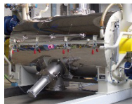
Isolierung aller gekühlten Behälteroberflächen