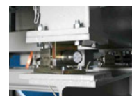
Mischer auf Wägezellen, z.B. zur Entleersteuerung