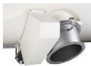
Ausrüstung mit zusätzlichen Ausläufen