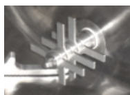
Messerkopf zur verfahrens- technischen Optimierung